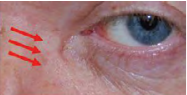
ندوبات جلدية باهتة بعد ثلاثة شهور من إجراء الجراحة الخارجية

تتم إزالة الفرز عادة بعد خمسة إلى سبعة أيام. كما تُزال الأنابيب بعد بضعة أسابيع تتراوح عادة بين ٤ و ١٢ أسبوعاً.